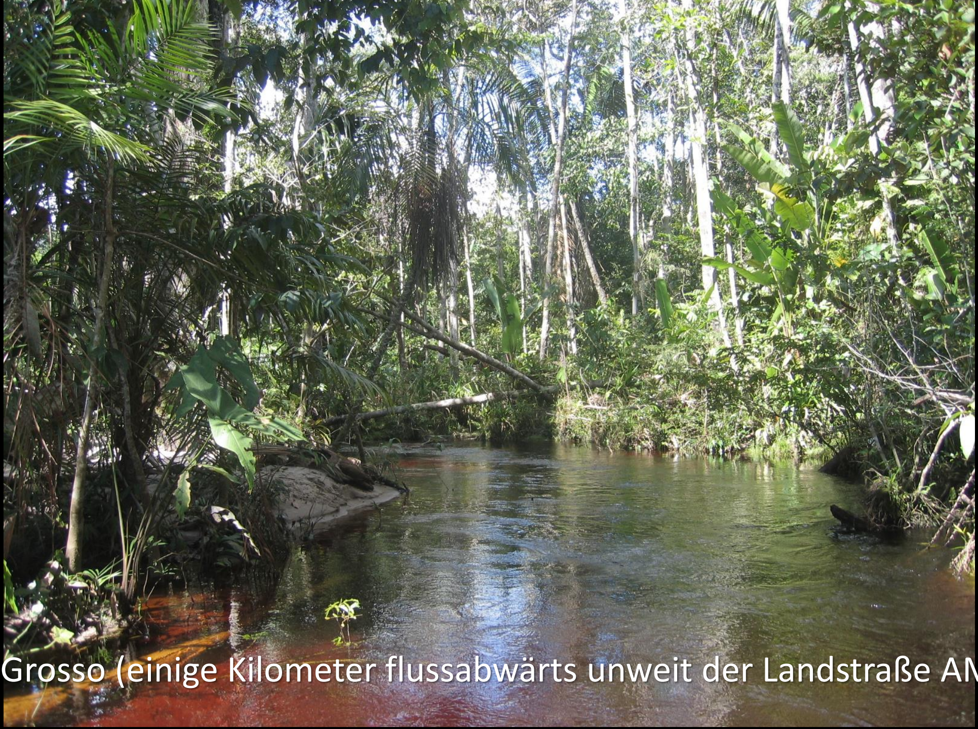
Mato Grosso (einige Kilometer flussabwärts unweit der Landstraße AM-352)