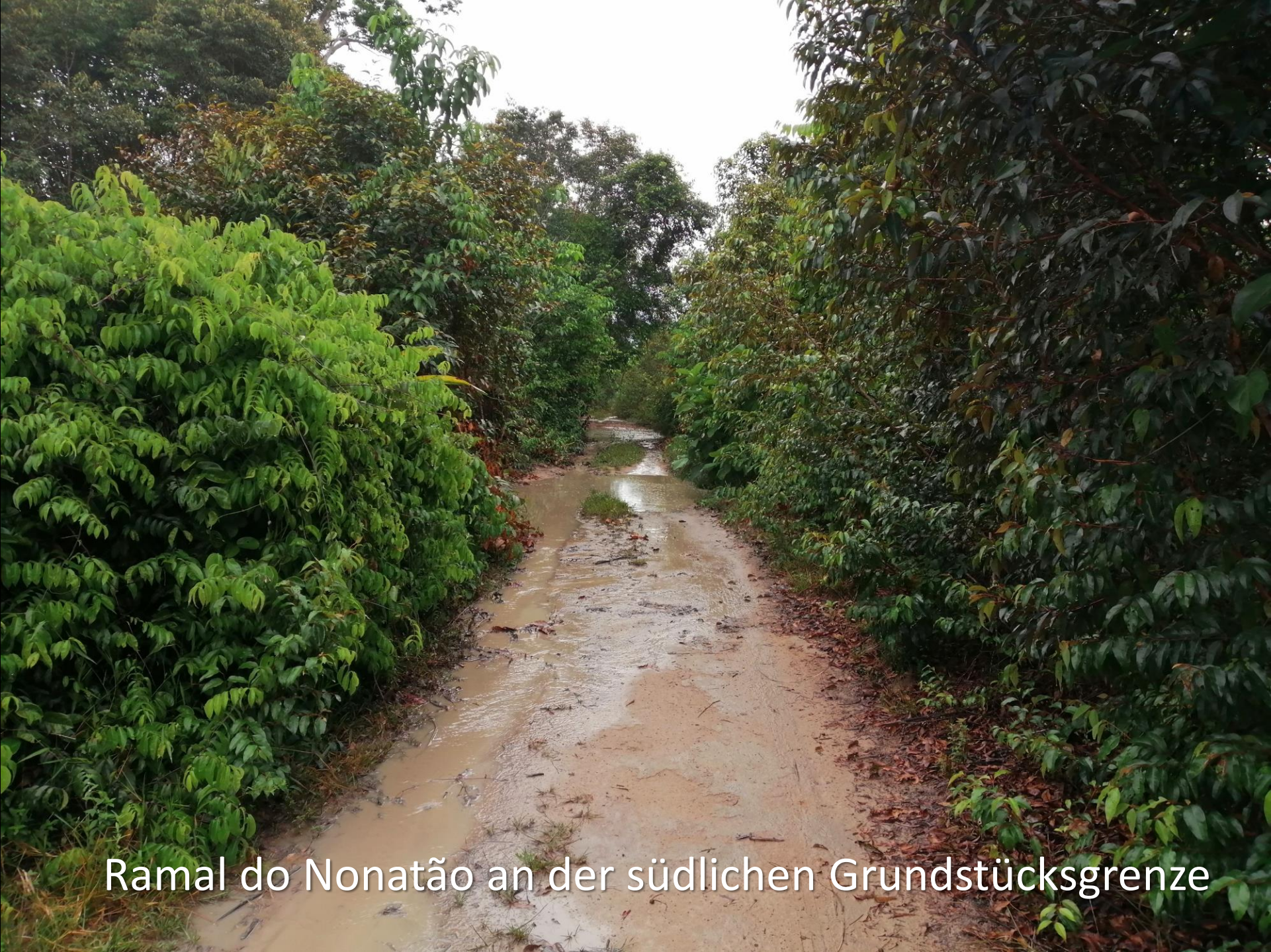
Ramal do Nonatão an der südlichen Grundstücksgrenze