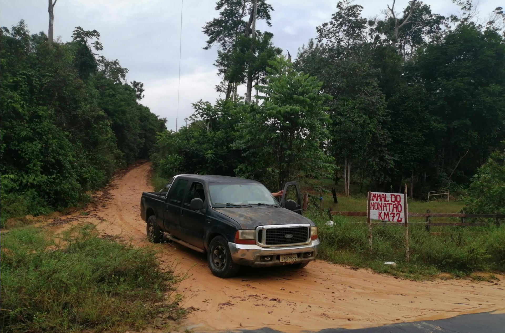
Einfahrt zum Ramal („Feldweg“) do Nonatão